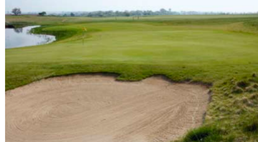
På andet hul kan sværhedsgraden øges væsentligt med flaget placeret tæt ved vandet

Der er også mulighed for at variere banen meget fra dag til dag. Specielt de meget store greens, ofte 750-800 kvadratmeter, giver variationsmuligheder. Ikke alene kan hullets længde på de fleste huller variere op til 30 meter alt efter om flaget er placeret i forkanten eller i bagkanten af green, men sværhedsgraden