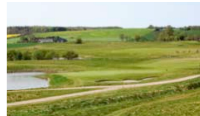
Fra klubhusets terrasse er der godt udsyn til bl.a. det spændende afslutningshul

hullet, hvis man ikke skal have et meget svært put. Som det hører sig til på en rigtig moderne mesterskabsbane, så er afslutningshullet på Dragsholm også spektakulært. 388m/326m dogleg højre med mulighed for at tage chancen og skære noget længde af i drivet. Greenen er godt beskyttet af bunkers i venstre side, og en sø i højre, og det er oven i købet planen, at søen skal udvides, så den også skærer ind foran green. Her kommer alt lige fra birdies til dobbeltbogeys eller højere.