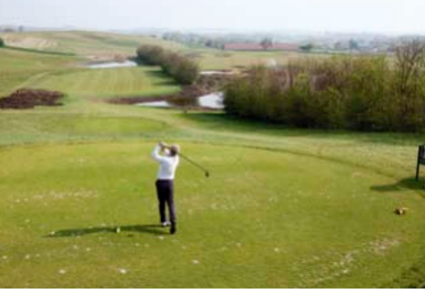
Udslaget på 3. hul, hvor man kan satse eller spille sikkert

søen i højre, og vælger man en mere sikker linie ned langs venstre, så får man selvfølgelig et længere slag ind til green.