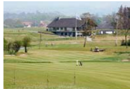
På 15. hul er der vandhazarder ca. 100 før green og igen helt oppe ved green

>> tee), så kan man slå ind over sø og træer i højre side og korte hullets 308m væsentligt af.